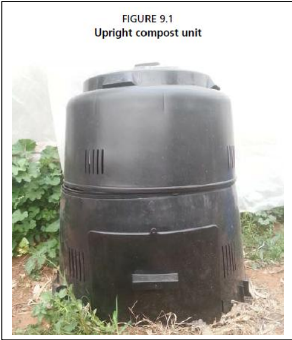
FIGURE 9.1 Upright compost unit

Quando si effettua il compostaggio, è importante gestire i materiali che si introducono. Per mantenere un buon rapporto di materiale organico umido e secco è meglio stratificandolo in quantità idonea a raggiungere un contenuto di umidità di circa il 60-70 per cento. Poiché nelle prime 2-3 settimane si verifica un processo aerobico termico con temperature fino a 60-70 °C, è importante evitare l'eccessiva umidità che ridurrebbe il calore. La fase termica accelera il processo di compostaggio e aiuta a pastorizzare i rifiuti organici da ogni possibile patogeno. La stratificazione è importante al fine evitare che il compost sia troppo bagnato e evitare zone anaerobiche. L'aerazione frequente del cumulo è importante, al fine di mantenere batteri in condizioni aerobiche per processare i rifiuti uniformemente. L'operazione consiste semplicemente nell'inversione periodica e completa della stratificazione dei rifiuti. Questo aiuta l'aerazione a