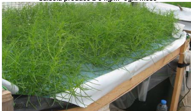
Fig. 9.18 - Salsola spp. Crescendo in acqua salata due terzi rispetto al mare. Salsola produce 2-5 kg/m 2 ogni mese

Alcune specie sono colture speciali altamente apprezzate, come la Salsola spp. , il finocchio di mare, Atriplex spp. o Salicornia spp. , mentre altre vengono raccolte per i semi, come miglio perlato, la quinoa, il crine marino e altri ancora possono essere coltivati per il biodiesel. Le condizioni saline ideali per le piante alofite sono tra di un terzo e la metà della salinità del mare, ma alcune piante sono tolleranti a condizioni ipersaline.