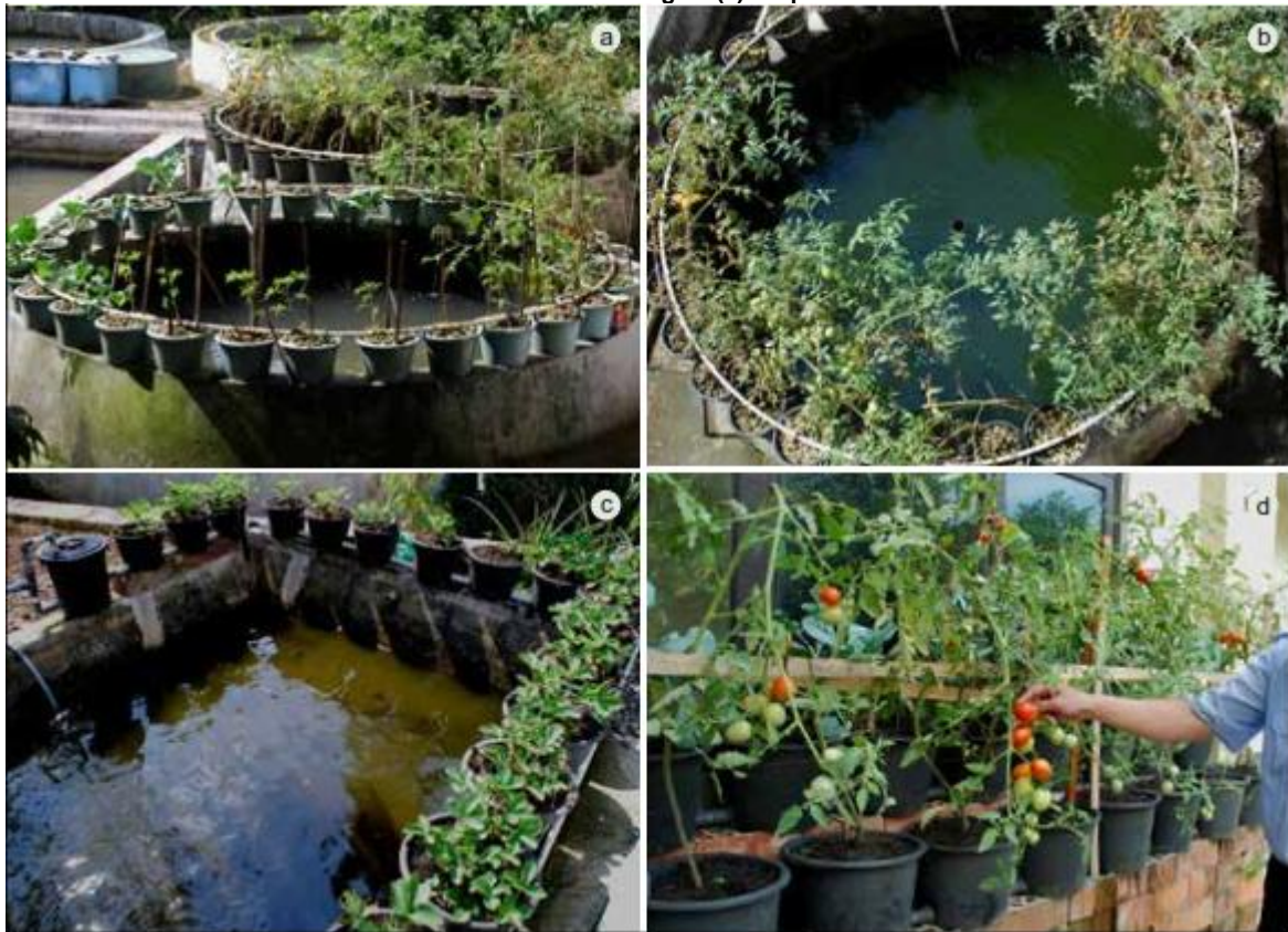
Fig. 9.21 - Sistemi di Bumina in Indonesia con vasca centrale per il pesce in cemento (a, b) circondati da letti di crescita satellitari coltivati a fragole (c) e a pomodori (d)

Bumina e Yumina sono usati come una componente importante di sistemi di autoproduzione di cibo promosso da iniziative per la sicurezza in tutta l'Indonesia volte ad aumentare la produzione domestica di proteine.