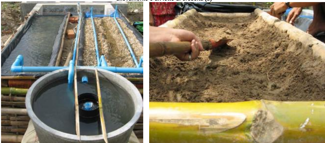
Fig. 9.17 - Un telaio di bambù è riempito di terreno (a), scavato e poi foderato con polietilene per creare una vasca di allevamento e un letto di crescita (b)

Utilizzando prezzi locali, un impianto acquaponico di 27 m 2 collocato all'interno di una struttura di bambù e rete alimentato da pannello solare costa 25 dollari americani/m 2 . Questo sistema fornisce un utile netto di 1,6-2,2 dollari/giorno dalle verdure e una razione giornaliera di 400 g di tilapia per il consumo domestico.